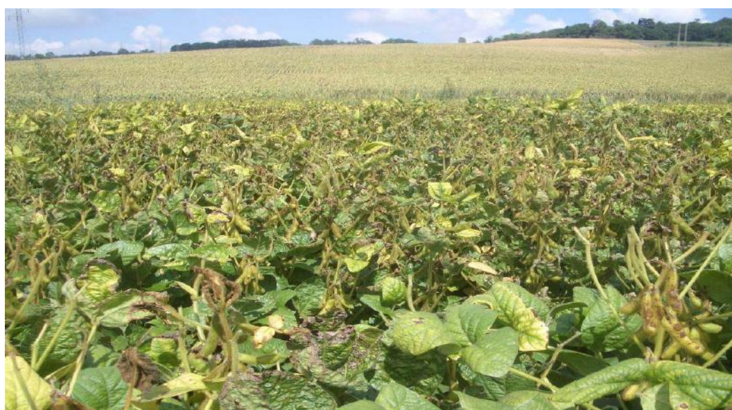
Décoloration et grillure sur feuille le 7 septembre 2005.