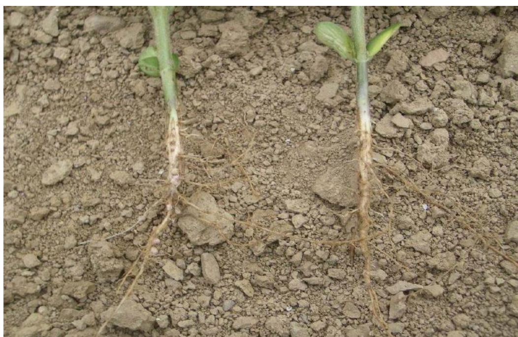
Soja sans décoloration avec nodosité ; soja avec décoloration sans nodosité