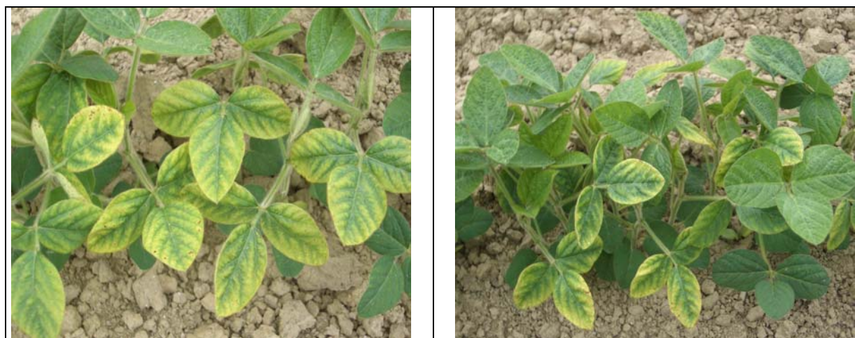
Décoloration jaune sur jeunes plantes